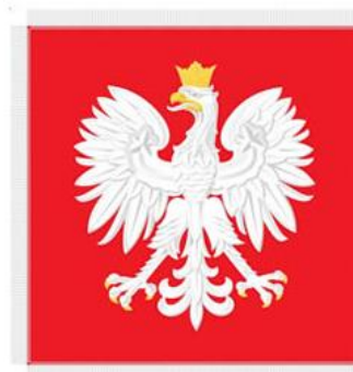
Prawa strona płata

Na stronie prawej płata sztandaru – barwy koloru czerwonego, znajduje się umieszczony centralnie wizerunek Orła Białego o wymiarach nie mniejszych niż 2/3 powierzchni płata, ustalony dla godła Rzeczypospolitej Polskiej, haftowany wypukłym srebrnym szychem, a korona, dziób i szpony – haftowane złotym szychem. Boki płata, z wyjątkiem boku mocowanego do drzewca, są obszyte srebrną frędzlą o szerokości 5 lub 7 cm.